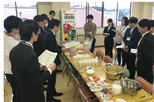
プライベートブランド商品食べ比べ

1日の短期プログラムの他、夏休みを利用した10日間プログラムや新潟大学キャリアセンター様と連携した2か月間に亘るインターンシップなどバリエーションを増やし実施しました。店舗作業をはじめ商品開発、店長の仕事を学び、物流センター見学や秋冬をイメージしたサラダ提案も行いました。