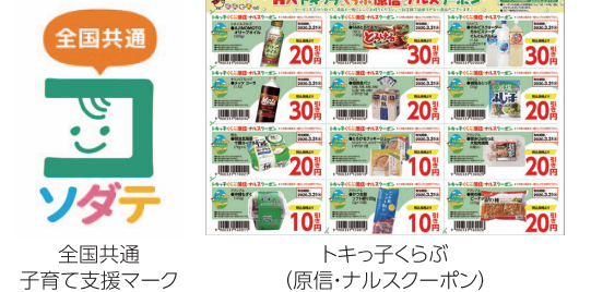
全国共通 子育て支援マーク

自治体や民間団体の子育て支援事業に、お買上げ金額の5%割引や独自のクーポン配布という形で参加しています。また他県の子育て支援カードのご提示でも、店舗のある地域で行なっている対象サービスを提供いたします。