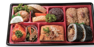
米百俵の想い御膳

この御膳は長岡名物「醤油赤飯」「栃尾の油揚げ焼」や原信・ナルス名物「手作りおはぎ」などを詰め合わせたお弁当で、その売上金の一部を長岡の子どもたちの未来応援に取り組む公益財団法人長岡市米百俵財団様へ寄付いたしました。