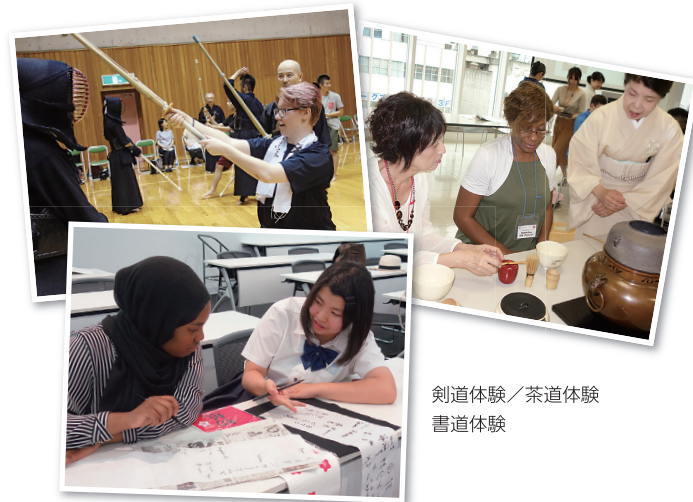
剣道体験／茶道体験 書道体験

日米で16名の高校生が参加し、長岡市の姉妹都市である、アメリカ・テキサス州フォートワース市の高校生と長岡市の高校生がペアとなり、お互いにホームステイをすることで、両国の文化の違いを体験しました。