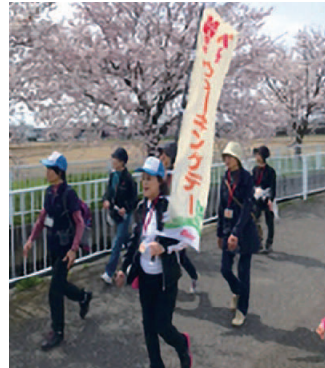
原信・ナルスウォーキングDAY

原信とナルスでは、お客様の健康を「食事」の面だけでなく、「運動」についてもサポートすることによって、より健康的な暮らしに寄与することを目的に、「原信・ナルスウォーキングDAY」を開催しています。