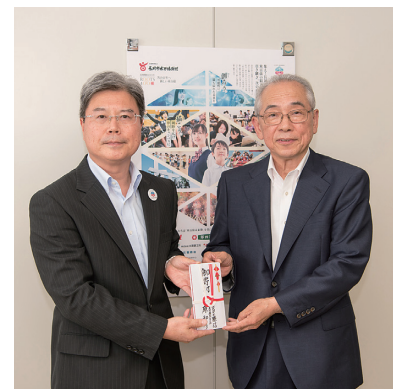
売上金の一部を寄付