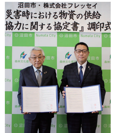
沼田市災害協定調印式

2019年度は新たに沼田市と災害時における物資の供給協力に関する協定を締結しました。