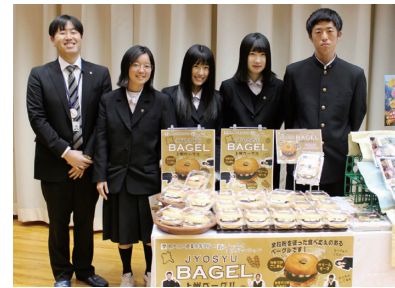
商品開発担当者と開発した高校生