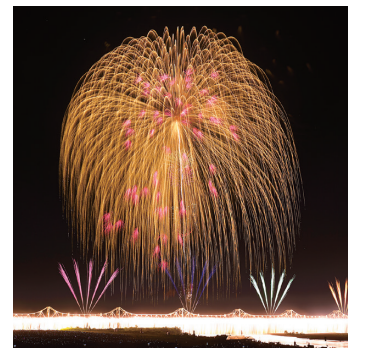
正三尺玉

なお原信では、日本三大花火大会の一つである長岡まつり大花火大会にて、戦争で亡くなった人の慰霊と復興に尽力した先人への感謝、世界平和を願う想いを込め、正三尺玉三連発を打ち上げております。