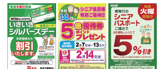
いきいき シルバースデー (原信)

またフレッシュの桐生・沼田地区の店舗では、毎週火曜日に「ぐーちよきシニアパスポート5%引きの日」を開催しております。