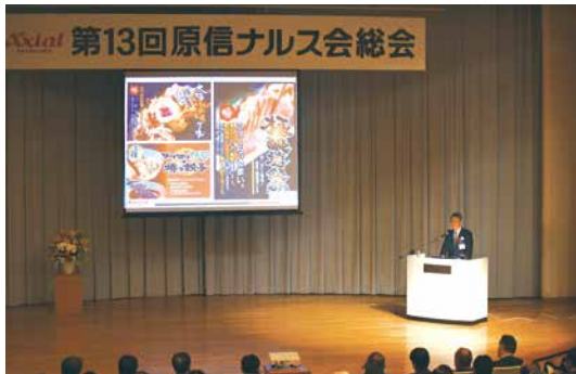
原信ナルス会総会

2019年9月に第13回原信ナルス会が開催されました。会員353社様が参加され、経営方針の説明と2件のQCサークル事例発表の後、情報交換会が開催されました。