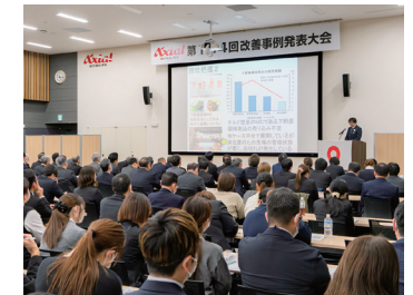
改善事例発表大会