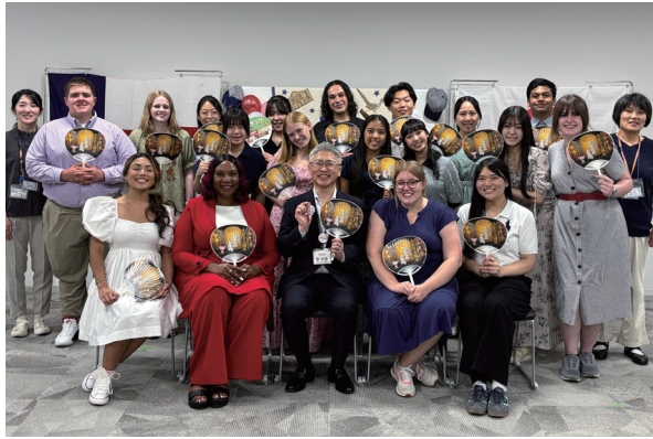
本部表敬訪問での記念撮影

長岡市とアメリカ・テキサス州フォートワース市の姉妹都市締結を機に、両市の高校生による交換プログラムを実施しています。本プログラムでは、日米の高校生がペアを組み、互いの国でホームステイを行うことで異文化への理解を深めます。1991年の開始以来、地域の皆様への恩返しと、次世代を担う若者たちに広い視野を持ってほしいという願いから継続してまいりました。原信が資金提供を行い、長岡市国際交流協会様との協力体制のもと、未来のグローバル人材を育てています。