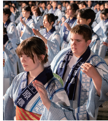
長岡まつり平和祭 大民踊流し