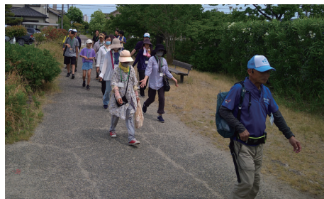
ウォーキングを楽しむ

2025年度は延べ516名の皆さまにご参加いただきました。今後も「食」に加えて「運動」の大切さを実感していただくきっかけとなるよう、本活動を継続してまいります。