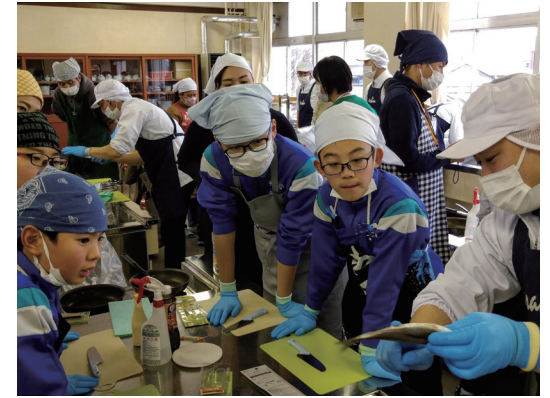
魚の構造から捌く場所を見極める