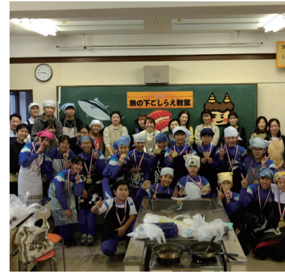
参加した生徒と保護者の皆様

テーマは、料理の基本である「下ごしらえ」です。昨今の「魚離れ」を踏まえ、栄養たっぷりの魚を身近に感じてもらえるよう、手軽で楽しい調理法を伝授。自らの手で料理を作る喜びを知る、大切なきっかけづくりを目指しています。