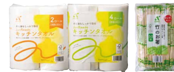
キッチンタオル 竹の割り箸

また「竹の割り箸」は、生育の早い竹を使用し、無理な 伐採を行わず定期的な計画に基づいて管理伐採した竹を 使用しているため、森林資源の保全に役立っています。