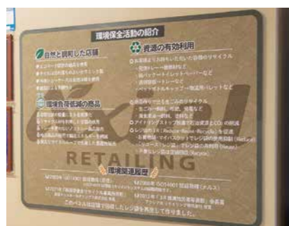
環境ボード(店頭で回収したレジ袋で作成)

リサイクルしたレジ袋は、原信やナルスの環 境活動を紹介した「環境ボード」などに生まれ変 わっています。