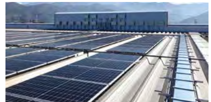
店舗の屋根に設置した太陽光パネル

このうち新潟市を中心とした6店舗については、新潟スワンエネルギー株式会社様との太陽光PPA（電力販売契約）モデル事業となり、2023年春から稼働開始しました。今後も設置店舗を順次拡大予定です。