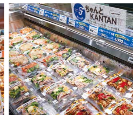
ちゃんとKANTANシーフード