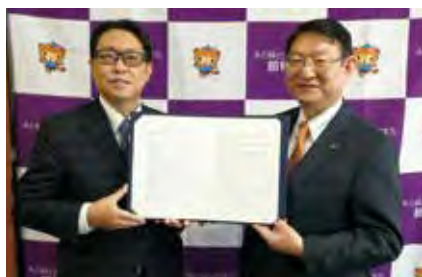
館林市との災害協定締結式

フレッセイは新たに群馬県藤岡市、太田市、館林市、栃木県足利市と「災害時における物資供給に関する協定」を締結し、自治体との災害協定締結数は12となりました。原信とナルスでは、新潟県と富山県内の9市と災害協定を締結しています。