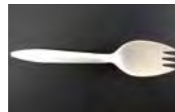
バイオマスプラスチックを 40%含んだスプーン(大)

プラスチック資源循環促進法施行に伴い、2022年4月より商品を召し上がる時にご利用いただくプラスチック製スプーンを有料にさせていただきました。これはライフスタイルを見直し、プラスチックの使い過ぎを抑制することが目的です。さらにバイオマスプラスチックを含んだ素材にすることで、よりプラスチック資源の削減に努めています。