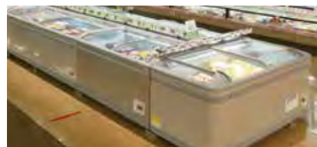
グリーン冷媒ショーケース

アクシアル リテイリングでは、冷媒の漏えいを管理するとともに、ショーケースにもグリーン冷媒を使用したものを導入しています。2021年度は45店舗に拡大しました。