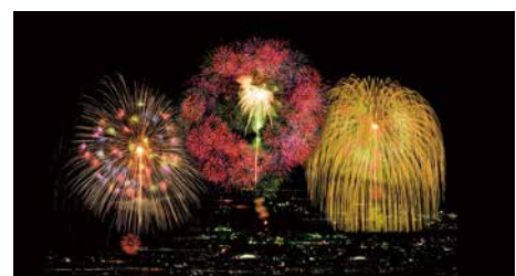
正三尺玉三連発 (合成写真)

アクシアル リテイリングでは、出店地域のお祭りに協賛をしています。世界平和の実現を願い、日本三大花火大会のひとつである『長岡まつり大花火大会』では原信提供正三尺玉三連発を打ち上げています。この花火は、「平和」「慰霊」「復興」の象徴でもあります。(2020年度は新型コロナウイルス感染症の影響に伴い中止)