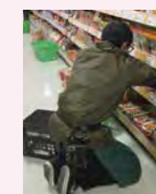
早朝補充業務での補充陳列作業

フレッセイヒューマンズネットでは、障がい者の雇用と高齢者の雇用に取り組んでいます。早朝補充業務においては、店舗ごとに高齢者を中心としたチームを編成し、開店前に商品の補充陳列作業を行うことで店舗作業の支援をしています。早朝・短時間・ルーチンワークのため、高齢の方にも始めやすく、地域の方が多数活躍をしています。