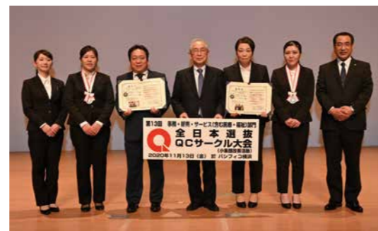
受賞したサークルのメンバー

2020年11月に開催された、第13回事務・販売・サービス部 門全日本選抜QCサークル大会において、「本部長賞金賞」を受 賞しました。原信ナルスグループは6年連続7回目、フレッセイ は初出場で金賞を受賞しました。