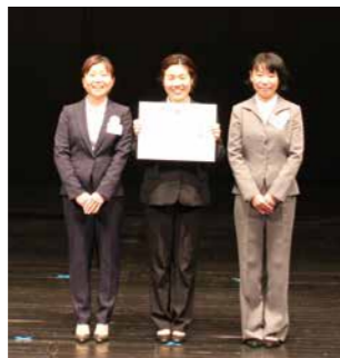
「さくらんぼ」サークルのメンバー

2020年10月に「第6269回新潟地区QCサークル 大会」が長岡で開催 され、最高賞である 「新潟県知事賞」を受 賞しました。2015年 以来の新潟県知事賞 となります。