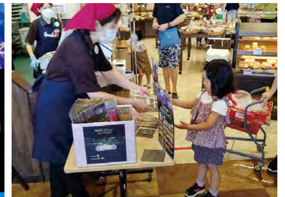
線香花火プレゼント