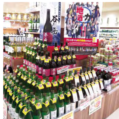
オリジナル限定日本酒

2020年6月に群馬県内の酒蔵様9蔵とフレッシュオリジナルのラベル・酒質で四合瓶約2,000本販売、2回目の12月には、さらに多くの酒蔵様と交渉を重ね、21蔵のオリジナル限定日本酒を約4,500本販売いたしました。