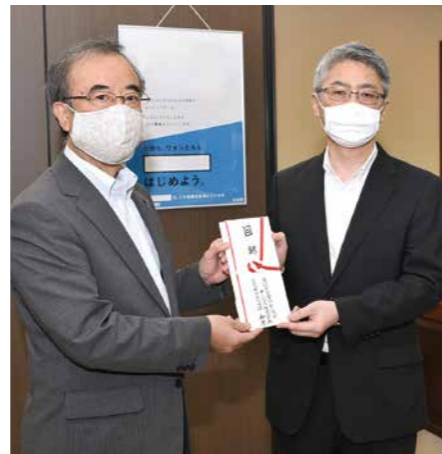
売上の一部を寄付(左:花角新潟県知事)

さらに新潟県の食材や郷土料理、新型コロナウイルス感染拡大によりお困りの業者様の食材などで構成したお弁当「がんばろう!新潟 エール弁当」を新潟県内の原信・ナルス70店舗で販売。売上金の一部を県内の医療従事者の活動支援、または県内のお困りの業者様への支援等に役立てていただくため新潟県に寄付しました。